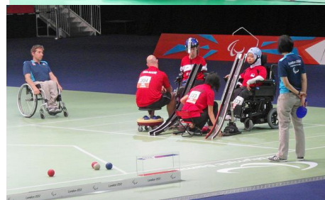
ジャックボール 無効ゾーン